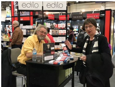
École de Rochemelle Ste-Foy